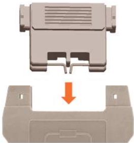
步骤三：再将组装好的二极管 装回元件插头