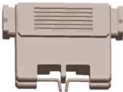
步骤2：将二极管的两端朝 ☒☒☒ 支架的中心弯曲