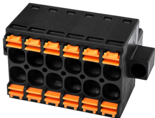
Twin connectors design, the pole number is half of the total connection points. photo shows a 12 connection product, the pole number is 06.