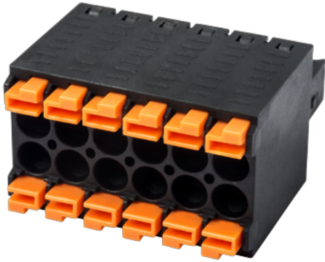
Twin connectors design, the pole number is half of the total connection points. photo shows a 12 connection product, the pole number is 06.