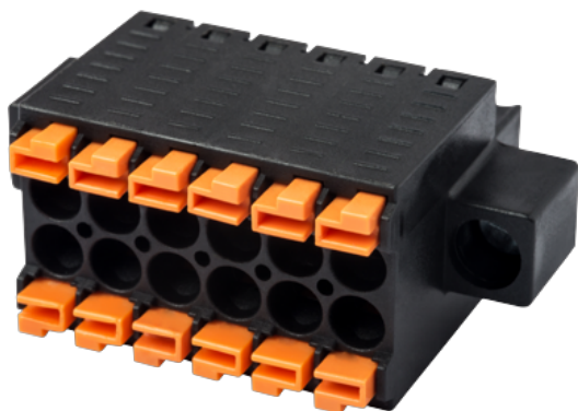
Twin connectors design, the pole number is half of the total connection points. photo shows a 12 connection product, the pole number is 06.